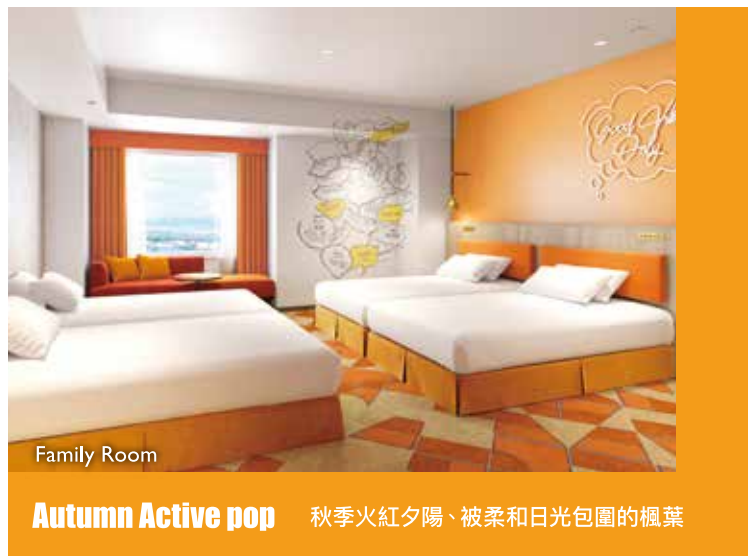
Family Room Autumn Active pop 秋季火紅夕陽、被柔和日光包圍的楓葉