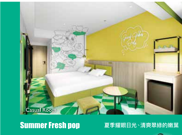
Casual Room Summer Fresh pop 夏季耀眼日光、清爽翠綠的嫩葉