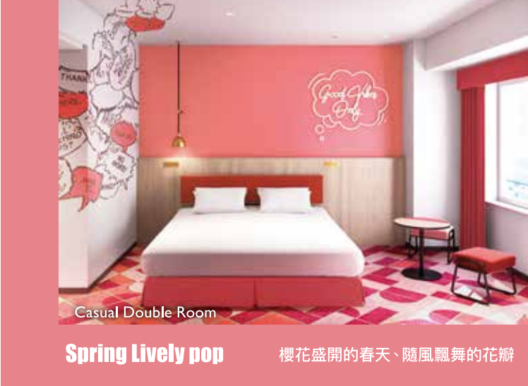
Casual Double Room Spring Lively pop 櫻花盛開的春天、隨風飄舞的花瓣

ACCESS 從JR新大阪車站出發...乘坐JR(京都會線・環狀線・夢咲線) 約20分鐘到達環球影城站 從JR大阪車站出發...乘坐JR(環狀線・夢咲線) 約12分鐘到達環球影城站 大阪國際機場(伊丹)出發...乘坐機場利木津巴士約45分鐘到 (前往日本環球影城) 關西國際機場出發...乘坐機場利木津巴士約70分鐘到 阪神高速灣岸線北港JCT分岔後,往環球影城出口...開車約5分鐘