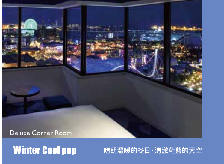
Deluxe Corner Room Winter Cool pop 晴朗溫暖的冬日、清澈蔚藍的天空