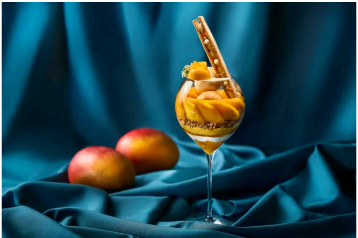
完熟マンゴーパフェ

丸みを帯びた優雅なパフェグラスに、完熟マンゴーをふんだんに使った贅沢なパフェをお届けします。ソルベとアイスに始まり、惜しげもなく重ねられた瑞々しいスライス、なめらかなパンナコッタ、ココナッツシャンティ、そして果肉を閉じ込めたジュレへと続く全8層。とろりと甘く芳醇なマンゴーが、食べ進めるごとに異なる顔を見せます。完熟マンゴーが最も輝く、5月だけの特別なパフェです。