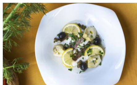
真鯛とカルチョッフィの蒸し物 レモン風味