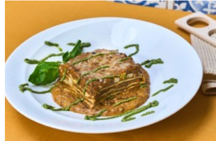
ラザーニャ ジェノバ風