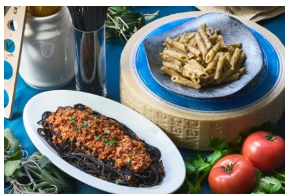
イカ墨のスパゲッティーニ タコのラグーソース/ ピアーヴェで仕上げたペンネ ポルチーニ茸風味