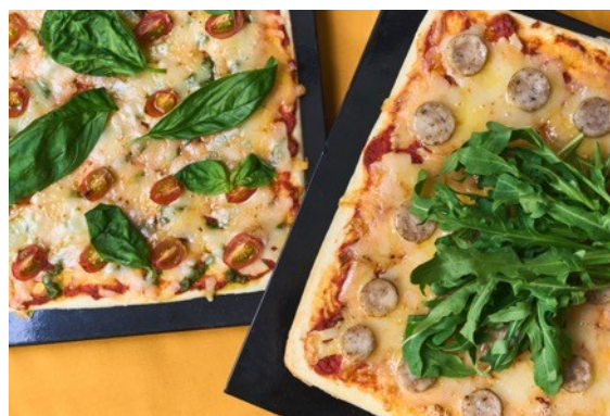
ピッツァ・マルゲリータ/ ピッツァ・サルシッチャとセルバチコ