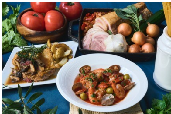
鶏もも肉のカチャトーラ風/魚介のリヴォルノ風/ フィレンツェ風ローストポーク