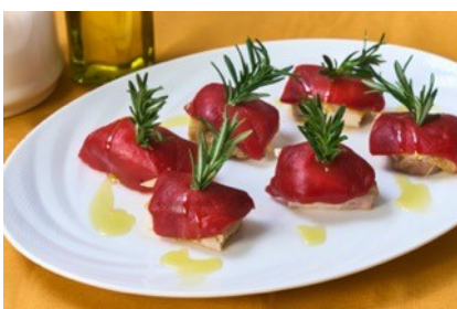
鶏もも肉とパプリカ アンチョビ風味

1971年京都生まれ。京都「カーサ ビアンカ」、東京アクアパツァで研鑽を積み、1999年「クッチーナ イル ヴィアーレ」を開業。以降「タヴェルナ イル ヴィアーレ」を展開し、2009年に本店を移転、「カ・デル ヴィアーレ」として一軒家レストランを実現。現在は京都市内で5店舗を運営し、京都イタリア料理研究会会長として食文化の発信に尽力。