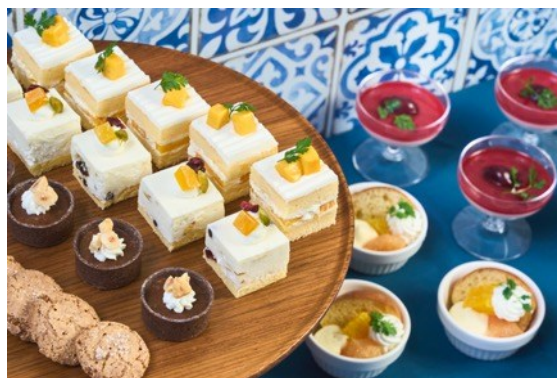
デザート集合イメージ