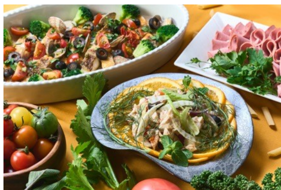
モルタデッラ/アクアパッツア/ カジキとオレンジのサラダ仕立て

季節のショートケーキ/パンナコッタベリーソース添え/レモンムース/いちごとピスタチオのタルト/ティラミス/カッサータ/アマレッティ/レモンケーキ/マCHEDONIA/ババ(土日祝限定)