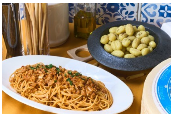
ピアーヴェで仕上げたニョッキ黒胡椒とオリーブオイル の香り/スパゲッティーニ ラグー・ディ・マイアーレ