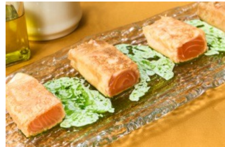
サーモンのパートフィロ包み ヨーグルトソースとバセリオイル