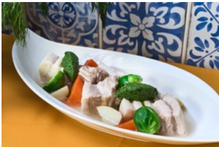
京都産もち豚バラ肉のポッリート サルサヴェルデ添え

1964年大阪府生まれ。サービスに魅せられ料理の世界へ入り、関西のイタリア料理店で研鑽を積む。フジテレビ「料理の鉄人」で東西イタリアン対決を経験。2002年、「京都発信」のイタリアンを掲げ「イル ギオットーネ」を開店。ミラノの料理サミット「イデンティタ・ゴローゼ」やミラノ万博 JAPAN DAY に参加するなど国際的に活躍し、現在はメディアでも幅広く活動。