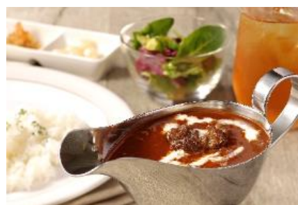
▲牛すじ肉のカレー