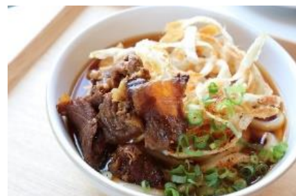
▲肉ごぼう天うどん