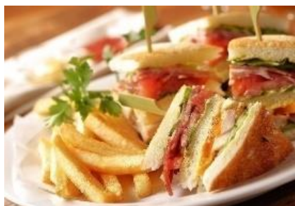
▲クラブハウスサンド