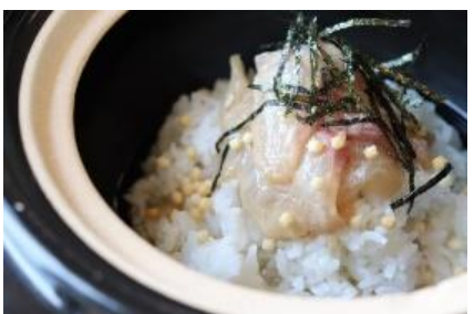
▲真鯛のだし茶漬け