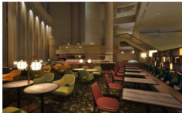
ゲストラウンジイメージ