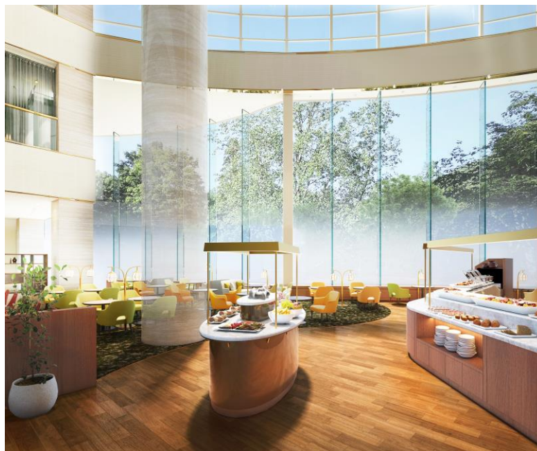
レストラン&ゲストラウンジ『パルミエール』店舗イメージ

<本件に関する報道関係各位からのお問い合わせ先> 都ホテル 四日市 セールス&マーケティング部 〒510-0075 三重県四日市市安島1-3-38 TEL：059-355-2806 FAX：059-352-4163