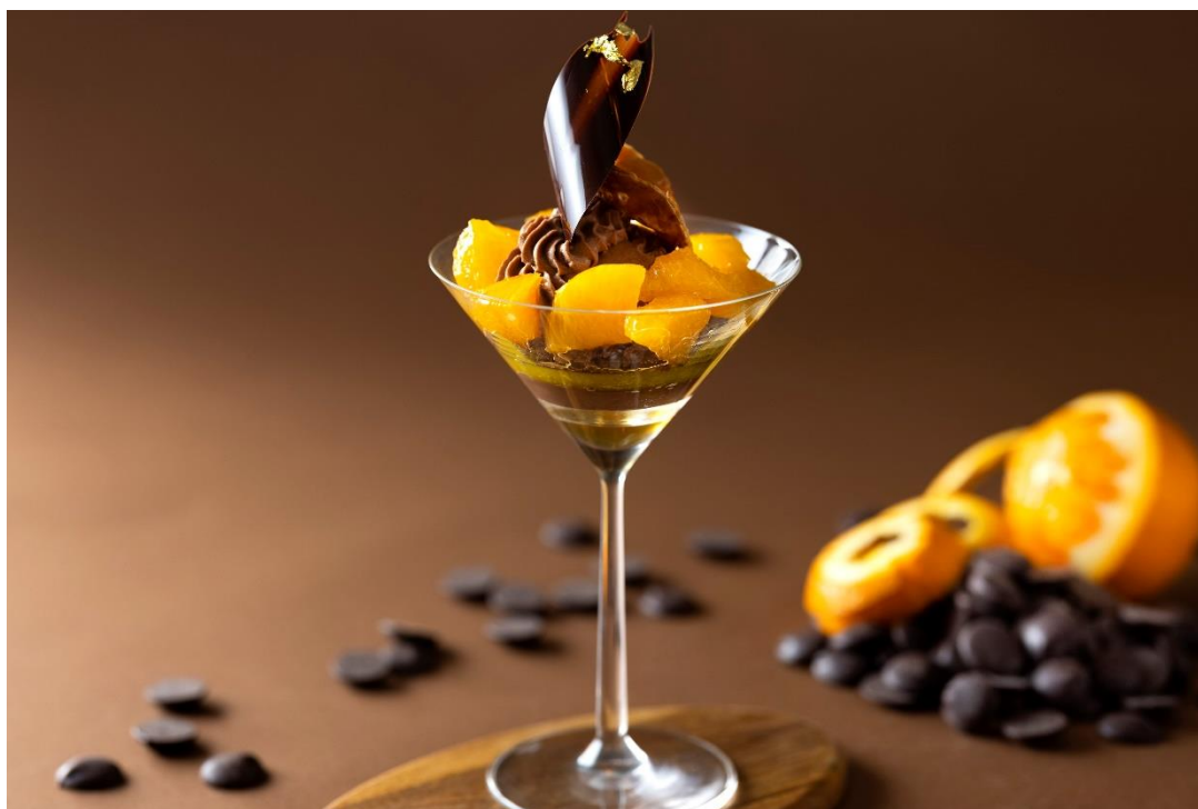
パルフェ ショコラオレンジ

毎年人気のタブレットショコラとテリーヌショコラに加え、今年は少し苦めのチョコレートプリンが仲間入り。店内では、自分へのご褒美にぴったりな、洋酒が効いたチョコレートとオレンジのパフェ“パルフェ ショコラオレンジ”をご用意します。