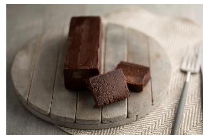
テリーヌショコラ