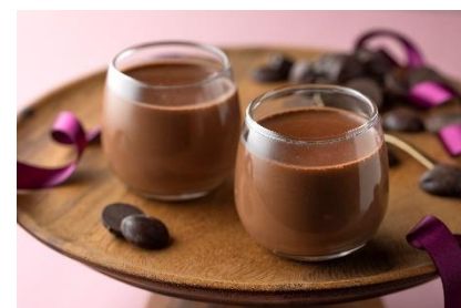
プディング オ ショコラ