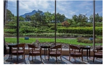
都ホテル 岐阜長良川