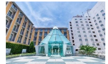
都ホテル 京都八条