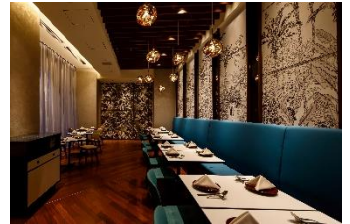
都シティ 大阪本町