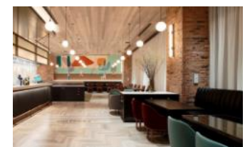
都シティ 東京高輪