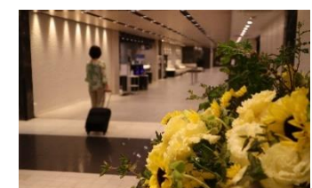
都シティ 近鉄京都駅