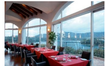
都リゾート 志摩 ベイサイドテラス