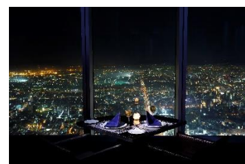
大阪マリオット都ホテル