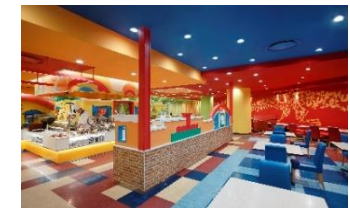
ホテル近鉄ユニバーサル・シティ