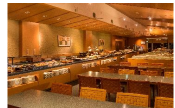
都リゾート 奥志摩 アクアフォレスト