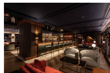
ウェスティン都ホテル京都