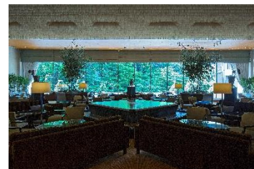
シェラトン都ホテル東京