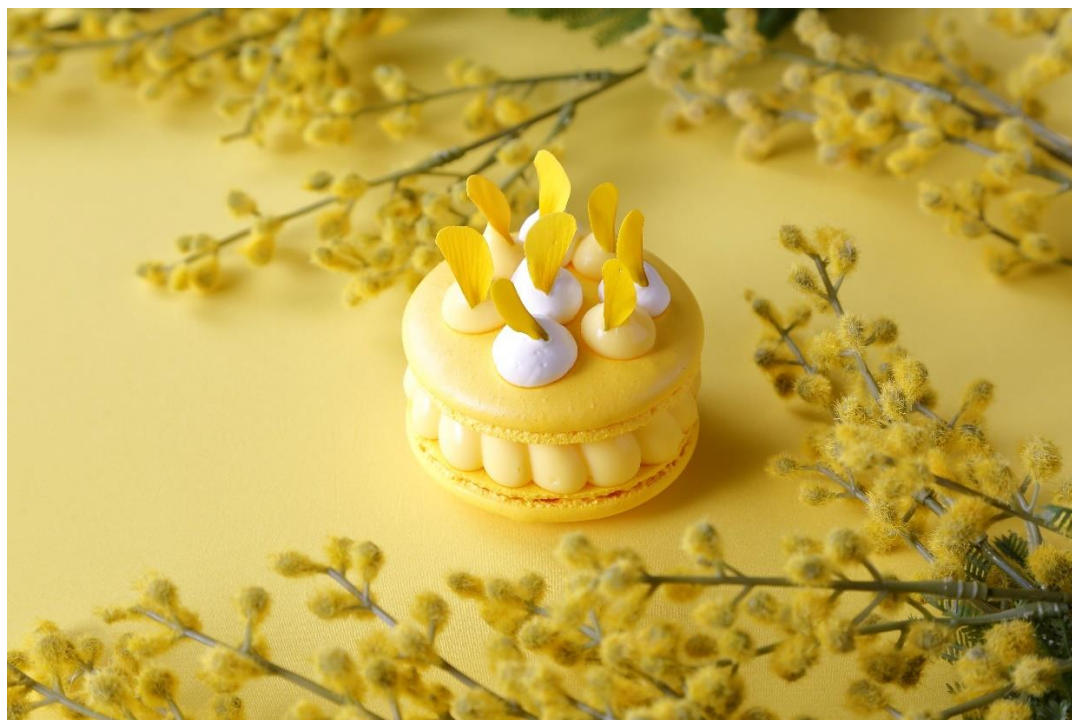
大阪マリオット都ホテル 「LOUNG PLUS」(ラウンジプラス)

企業として女性を支援する持続可能な取り組みで社会に貢献していきます。詳細は別紙をご覧ください。