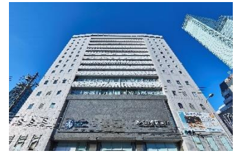
都シティ 大阪天王寺