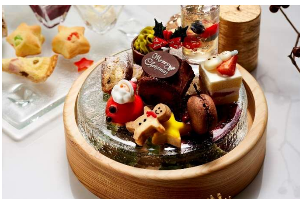
スイーツイメージ

お飲物には、紅茶・ハーブティーは英国ブランド「JING TEA」のほか、コーヒーや中国茶、アレンジコーヒーや祇園辻利の煎茶、一保堂のくきほうじ茶などからご自由にお楽しみいただけます。