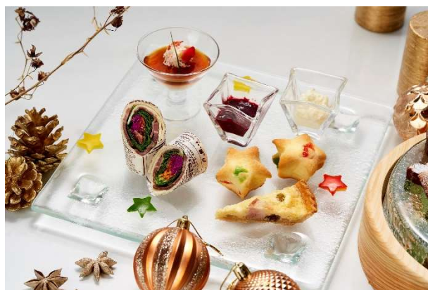
セイボリーイメージ