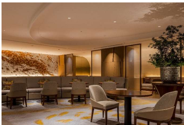
メイフェア店内イメージ

スコーン(ベリージャム・クロテッドクリーム付き)/ブロッコリーとベーコンのキッシュ/ ローストビーフのラップサンドウィッチ/カリフラワーのピュレと甲殻類のジュレ