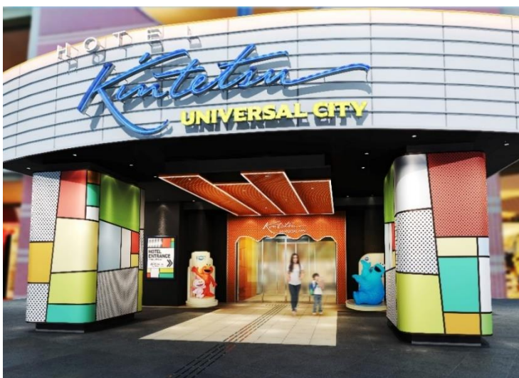
エントランスイメージ