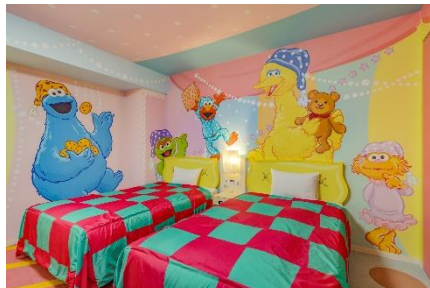
セサミストリート・パジャマパーティ・ルーム