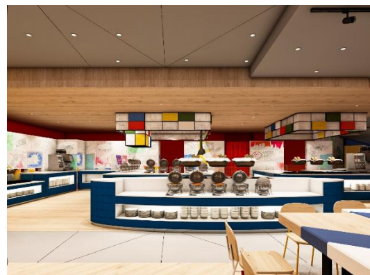
レストラン「イーボック」イメージ