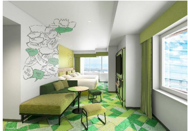
コーナーファミリールーム