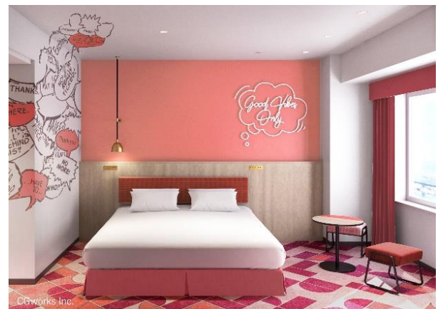
カジュアルダブルルーム