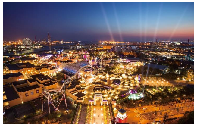
スタジオビュールームからの眺め（写真はイメージです）

また、ご家族での旅行時にも快適にお過ごしいただけるようにと、バンクベッド（2段ベッド）タイプや最大5名まで宿泊可能な客室、洗い場付きのバスルームも新設し、家族やグループなど様々なニーズでの旅行に可能な客室を拡充します。