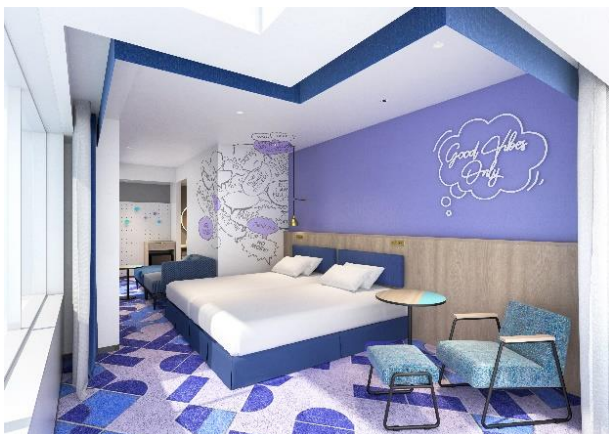
デラックスコーナールーム