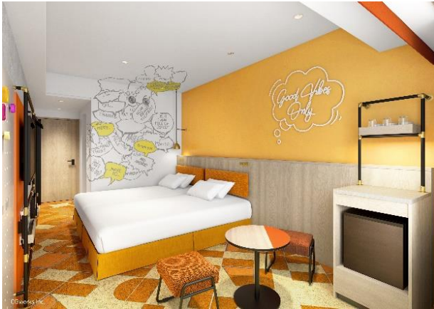
カジュアルルーム