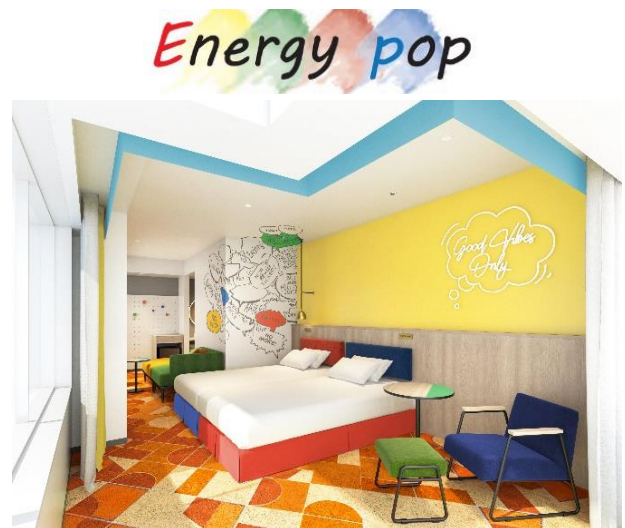
エナジーポップ コーナーファミリールーム

本改装で、新たに「Energy pop ルーム」という、エネルギッシュな配色でカラフルポップな客室をご提供します。ぜひこちらもご期待ください。