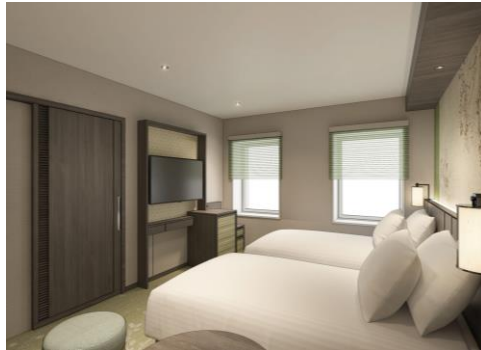
コンフォートフロア ワイドツイン イメージパース