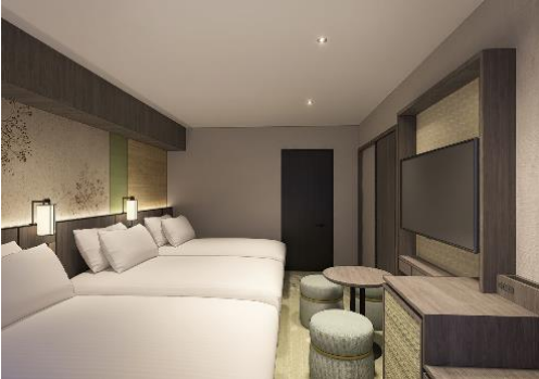
コンフォートフロア トリプル イメージパース

【対象】スタンダードツイン 41室、ミドルツイン 6室 ワイドツイン 10室 トリプル 6室 計 63室