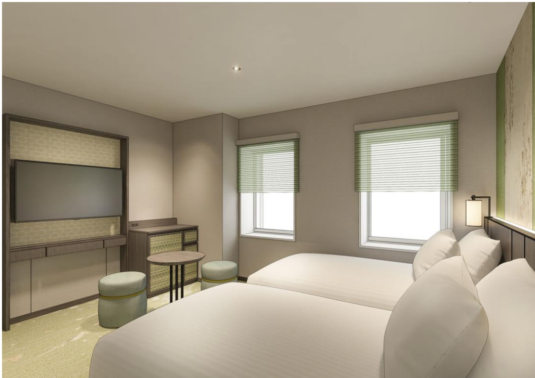
コンフォートフロア スタンダードツイン イメージパース

また、客室の快適性を追求し、都シティオリジナルベッドを導入いたします。新しく生まれ変わった客室をぜひお試しくください。詳細は別紙をご参照ください。