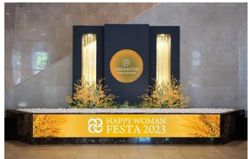
1階ロビー フラワー装飾イメージ

■HAPPY WOMAN®はパートナーシップで持続可能な開発目標 (SDGs) を支援する活動です。