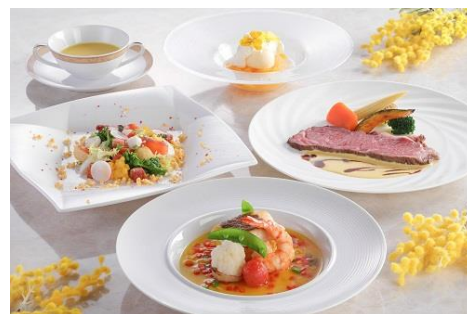
ミモザランチ 7,000 円コース