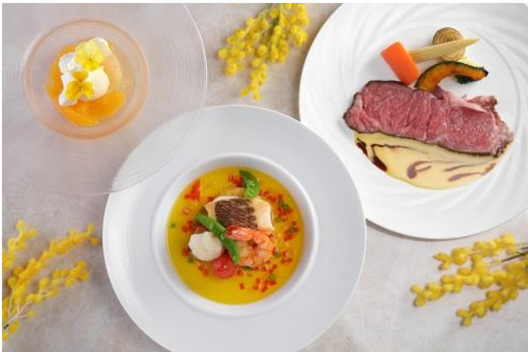
レストラン&ラウンジ・バー eu (ゆう) 「ミモザランチ」

開催期間中、HAPPY YELLOW のフラワーを飾り、明るく彩られたロビーで皆さまをお迎えします。詳細は別紙をご参照ください。