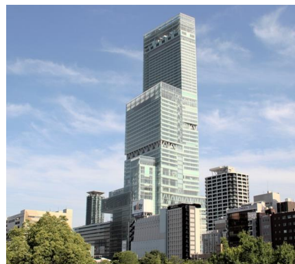
MARRIOTT OSAKA MIYAKO