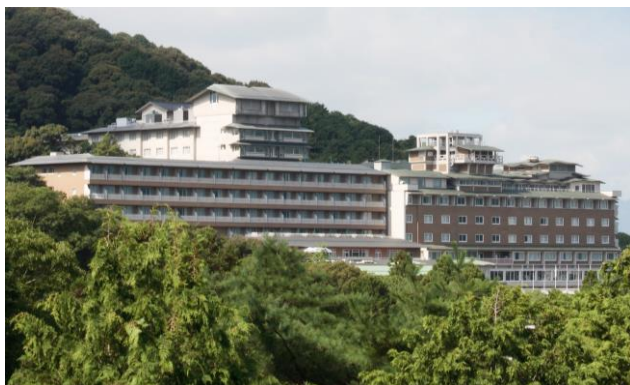
THE WESTIN MIYAKO KYOTO