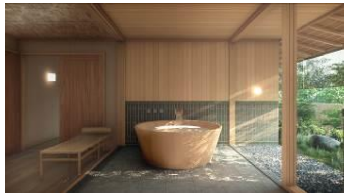
バスルーム(イメージ)