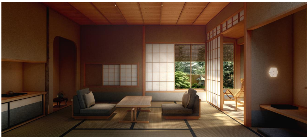
佳水園客室(イメージ)