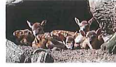
②通路沿いに同じ目線で母子鹿を見る事が出来ます。木の根元などに隠れている子鹿を見つけれらるかな!?