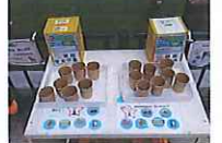
③会場専用のシカのおやつ。1個100円で、中に当たりが入っていたら素敵なプレゼントが当たります。