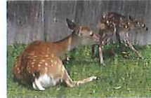
①上から母子鹿を見学する事ができます。