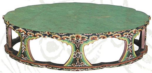
粉地彩繪八角几(中倉)