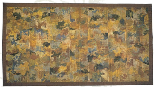
七條刺納樹皮色袈裟(北倉)