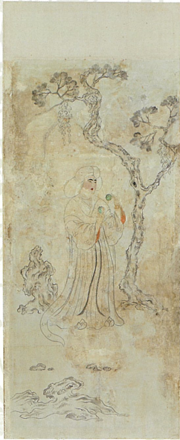
鳥毛立女屏風・第1扇(北倉)

およそ1300年前の奈良時代に、実際に宝物が用いられ、その後も守り伝えられてきたこの奈良の地で、天平の息吹を感じながら、宝物の魅力を存分にお楽しみください。