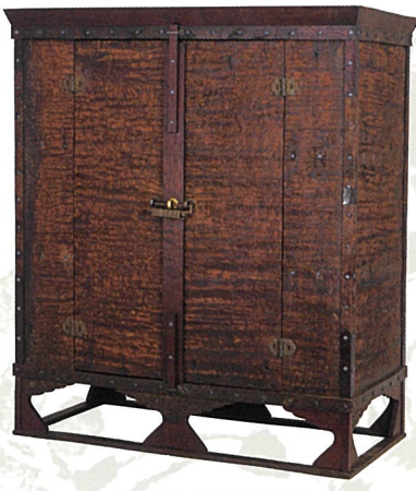
赤漆文櫛木御厨子(北倉)