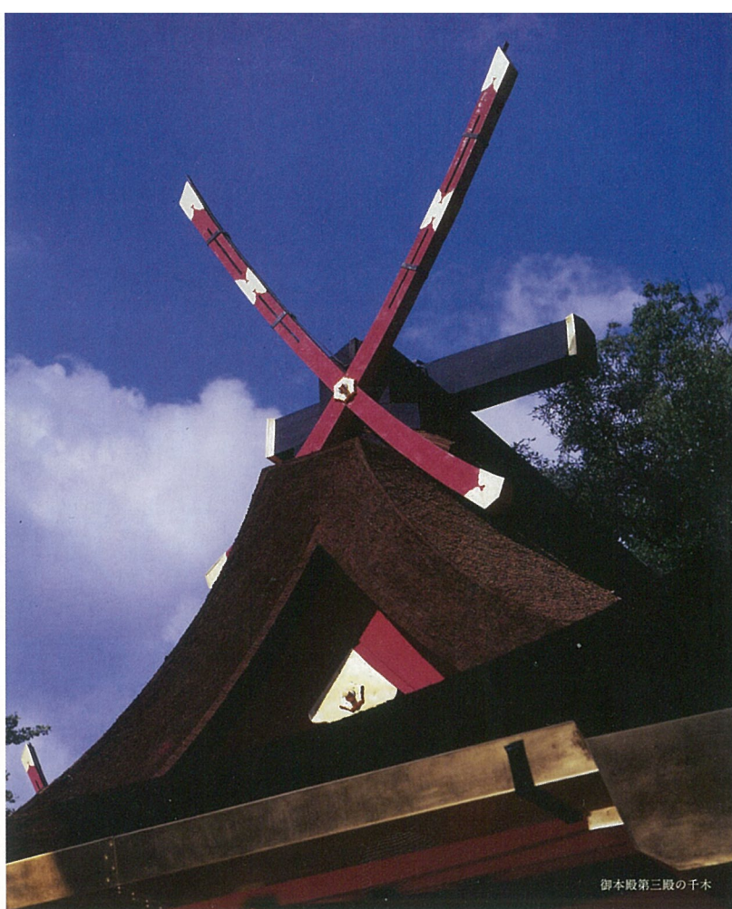
御本殿第三殿の千木