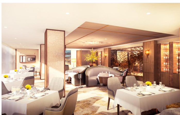
店舗内観(イメージパース)